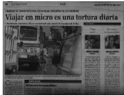
Usuarios heridos a raíz de imprudencia e incapacidad de los conductores (Diario ABC color – judiciales y policiales – jueves 08/03/07)