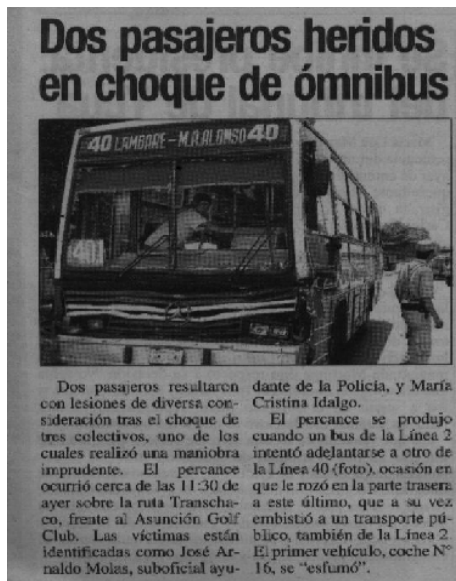
Los usuarios critican el desempeño de los conductores (Diario La Nación – País – jueves 18/01/07)