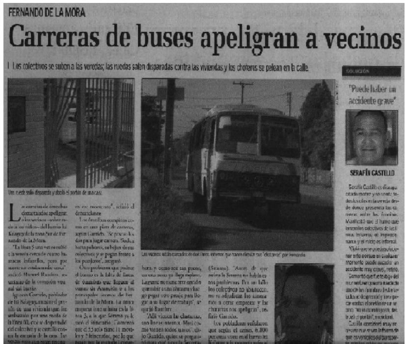
El juego de carreras que ponen en peligro la vida de los usuarios (Diario La Nación – País – miércoles 10/01/07)