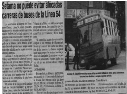
El juego de carreras que ponen en peligro a usuarios (Diario ABC color – locales – 30/01/06)