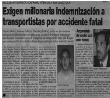
Conductores no capacitados para cumplir sus labores