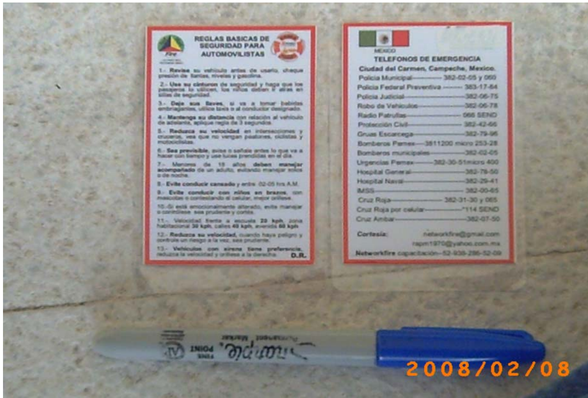
4 Tarjeta plastificada de bolsillo

5.3.- Tarjeta tipo credencial plastificada con las 13 RBSVA por un lado y por el otro lado los teléfonos de emergencia, con el fin de que el automovilista la porte en su cartera y en caso de un accidente pueda solicitar ayuda a los servicios de emergencia en forma inmediata.