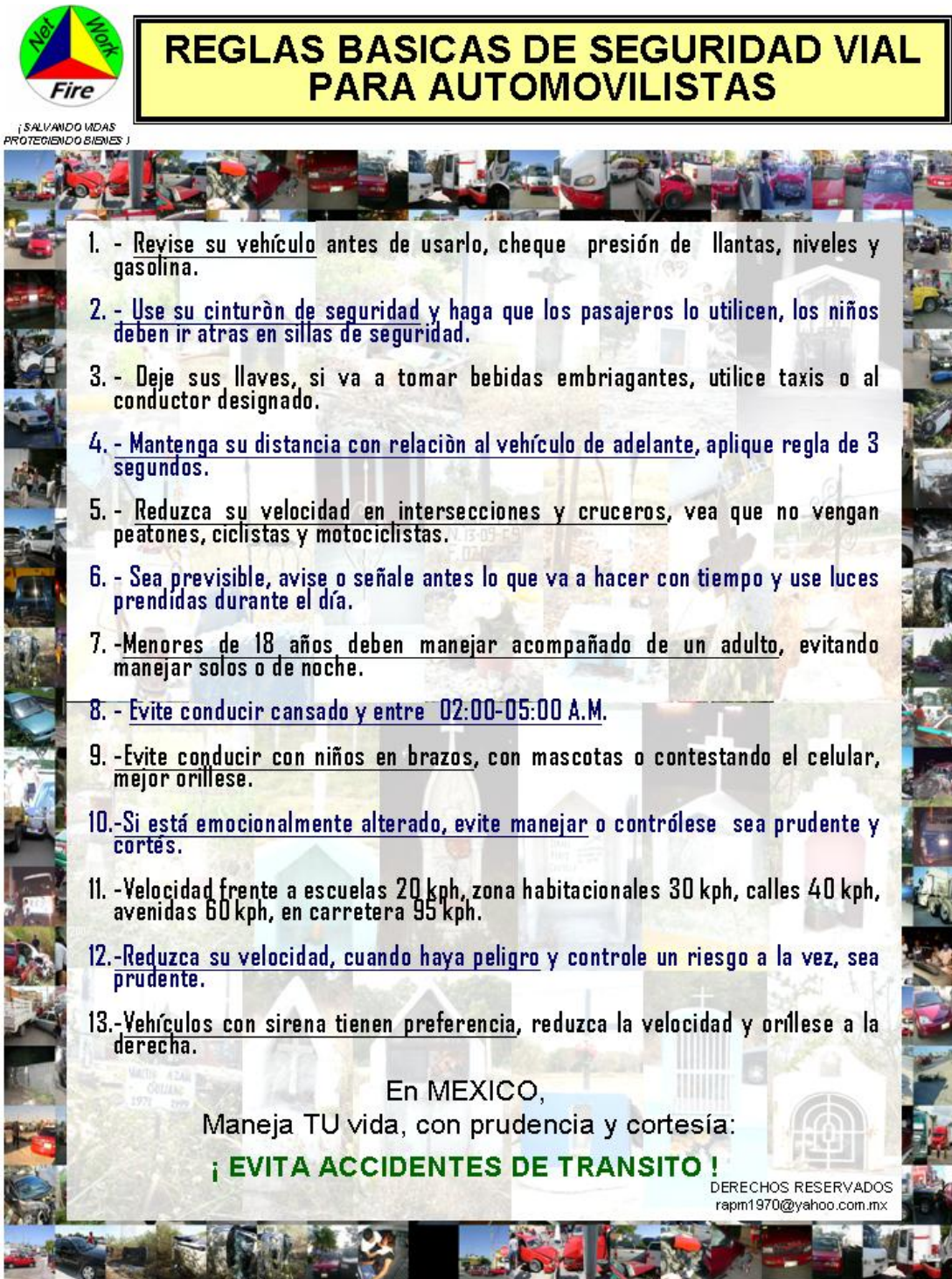
5 Póster espectacular

5.4.- Póster espectacular con las 13 RBSVA y un fondo con las criptas que se encuentran alrededor de la ciudad y un marco con las fotos de los choques sucedidos en el periodo de análisis.