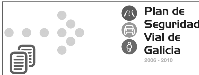
Ilustración 2. Imagen visual del Plan de Seguridad Vial de Galicia 2006-2010

(Xunta de Galicia, 2005). El plan fue elaborado con el apoyo técnico de la Asociación Española de la Carretera (AEC).