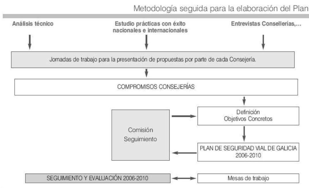
Gráfico 7: Método de trabajo del Plan de Seguridad Vial de Galicia 2006-2010.

La metodología seguida para la elaboración del plan gallego se ha fundamentado en siete soportes principales, tal y como se muestra en la gráfica siguiente (Xunta de Galicia, 2005): análisis de la movilidad e identificación de los aspectos característicos gallegos; análisis de la accidentalidad en Galicia e individualización de los problemas más destacados en materia de seguridad vial; recopilación y análisis de la documentación existente en relación a políticas de seguridad vial; entrevistas con los agentes implicados (consejerías, fuerzas policiales, asociaciones y otros tipos de agentes); puesta en común por parte de cada una de las Consellerías de la Xunta de las iniciativas contempladas, y generación de flujos de intereses comunes; elaboración del plan 2006-2010; y, por último, seguimiento del mismo. Esta metodología se representa en el propio documento elaborado por la Xunta gallega del siguiente modo: